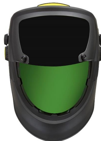
Iso sisempi hiontavisiiiri